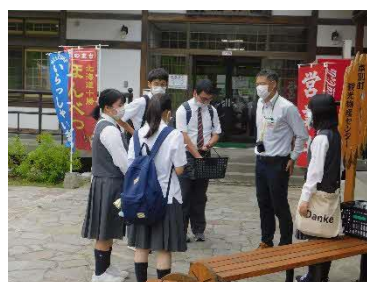
【夏休み中の調査活動】

生徒たちはコーチのサポートを受け、放課後や夏休み中にミーティングや調査活動を実施し、探究のプロセスを通して多くのことを学ぶことができました。