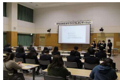
【まちづくりプレゼンテーション】

● 平取町役場主催の「まちづくりプレゼンテーション」に本校生徒が参加し、人口減少対策に対するアイデアを提言したところ、「早急に実現しよう」というお話をいただきました。生徒の発想が町に必要とされていることを強く感じるとともに、今後、学校と地域が一体となって地域の課題解決に取り組む体制づくりを一層進めていく必要があることから、学校運営協議会において、地域について考える取組の成果と課題を明らかにしながら、地域とともに成長する学校づくりを進めていきます。