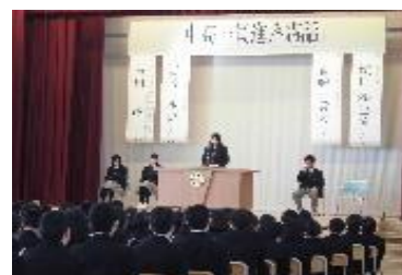
【高校生による進路講話】

進路が決定した高校3年生が、中学生に対して学校生活の過ごし方や学習方法など進路実現に向けた取組について発表する機会を設定したり、高校1・2年生が、中学生から高校進学に向けた学習や学校生活等について質問を受けるなどの場を設定したりしました。