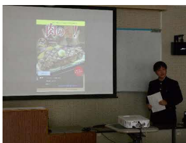
【企業との商品開発の様子】