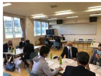
【学校のこれからを熟議】

今年度は、コロナ禍による臨時休業明けの6月からの指導計画を修正し、感染対策を講じながら教育活動を実施しました。学校経営目標「未来を生きる自立した人間の育成」を目指し、地域と協働して生徒を育む教育方針が学校運営協議会で承認されたことにより、コロナ禍においても多くの地域の協力を得ることができ、生徒に充実した教育活動を提供することができました。