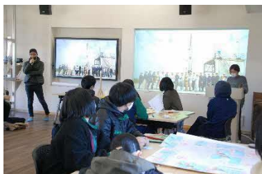
【まちのワクワク未来予想図ワークショップ】