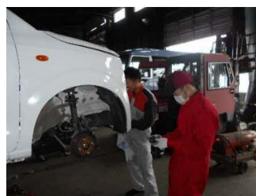
【職場体験実習の様子】