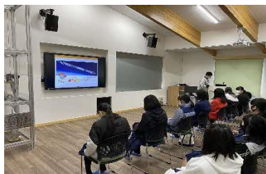
【大樹町宇宙交流センター見学】