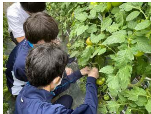
【トマト農家収穫体験】

学校運営協議会を通して、学校への地域の意見や助言を幅広く得ることにより、これまで地域と協働で行ってきた各種ボランティアへの参加やアイヌ文化についての学習、トマト農家での収穫体験、トマトクラブ*1の活動等、本校の教育活動をより一層推進する環境が整いました。