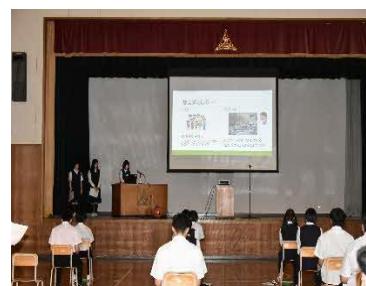
【地域への提言発表会の様子】

課題解決能力やコミュニケーション能力の向上などの資質・能力の育成を目的に、地域の課題を発見し、課題解決に向けた取組を行うとともに、学校及び地域の活性化を目指す取組として実践しています。