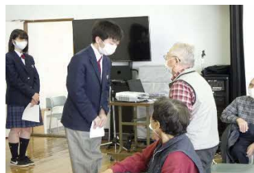
【町内福祉施設訪問】