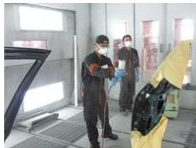
【インターンシップの様子】

また、インターンシップの体験を発表する「進路研究発表会」では、インターンシップ受入れに協力いただいた企業や事業所の方にも出席いただき、将来、職業人としてどのような力を身に付けるべきか講評いただくことにより、生徒が自らの進路についてより深く考える機会を得ることができました。